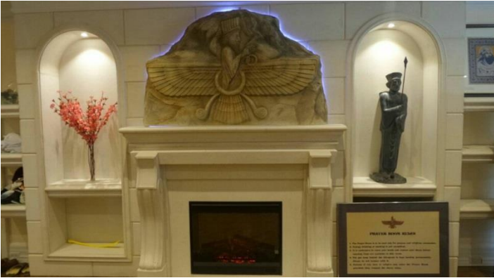
Beautiful Asho Farohar artefact leading to the Prayer Room