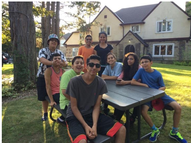
Our dedicated Youth Volunteers during the 5 Muktab Days