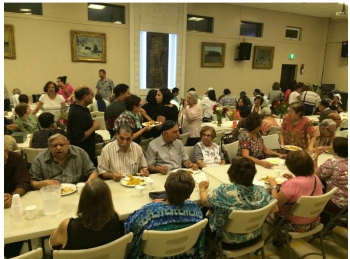
Over 200 Members enjoying a delicious dinner prepared by our Volunteer Super Chefs!